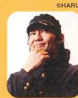
近藤良平 Ryohei Kondo

子どもも大人も思わず笑ってしまう仕掛け満載の愉快的盆踊り大会を、一緒に盛り上げてみませんか? ワークショップに参加して“にゅ〜盆踊り”をコンドルズから直伝・会得!!