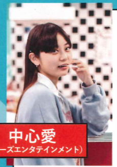
中心愛 (アローズエンタテインメント)