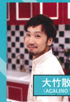
大竹散歩道 (ACALINO TOKYO)