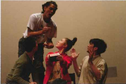
国際共同制作ワークショップ「Beautiful Trauma」©APAF2017

舞台監督：浦弘毅（ステージワークURAK） 演出助手：坂倉球水 音響：和田匡史 照明：島田雄峰（LST） 衣装：藤林さくら スチル撮影：松本和幸 記録動画撮影：古屋和臣